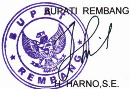
H. HARNO, S.E.

Pihak kedua akan melakukan supervisi yang diperlukan serta akan melakukan evaluasi terhadap capaian kinerja dari perjanjian ini dan mengambil tindakan yang diperlukan dalam rangka pemberian penghargaan dan sanksi.